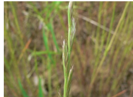
Ray-grass d'Italie ( Lolium multiflorum )