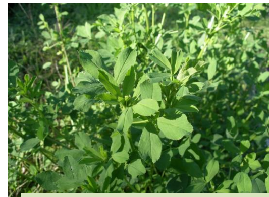
Luzerne cultivée ( Medicago sativa )